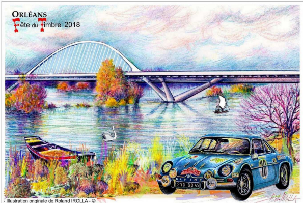
Carte locale Dessin original de Rolland IROLLA