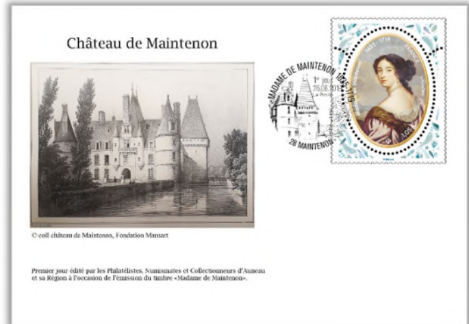
Enveloppe 1 er Jour 1