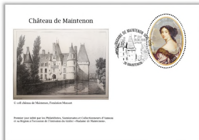
Enveloppe 1 er Jour 2